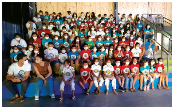
Alunos do Divina na cerimônia de inauguração