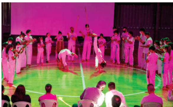
Grupo de Capoeira "A Ginga da Valorização"