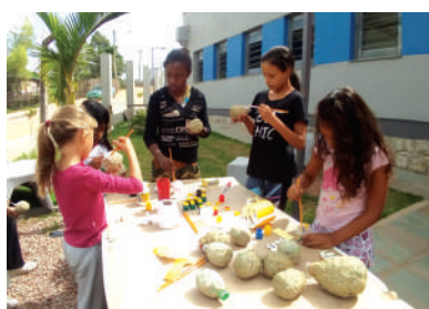
Oficina de Artesanato