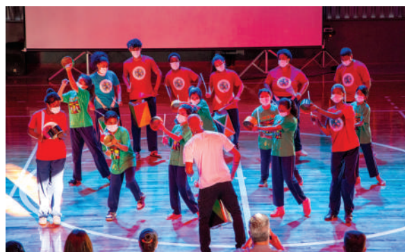
Grupo Bate Lata "O Som da Vila"