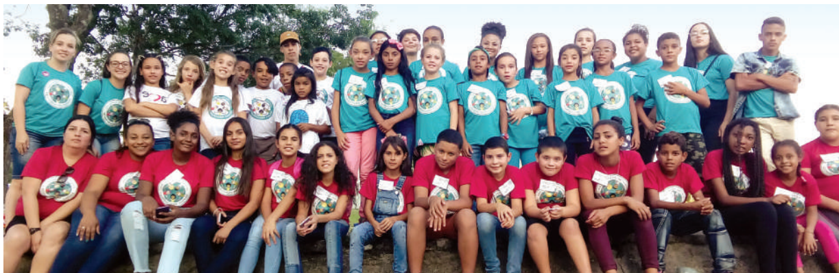
Alunos do Divina

No desabrochar da instituição, em 19 de julho de 2012, houve a implantação da área pedagógica. A moderna estrutura de mais de 430 m 2 é destinada às oficinas ocupacionais. No contraturno escolar, com a finalidade de promover