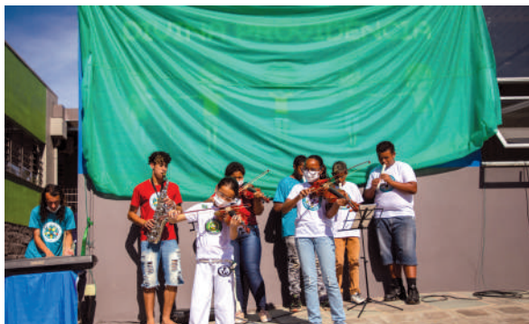
Orquestra "O Som da Fonte"