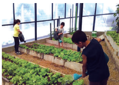
Oficina Verde é Vida - Horta Doméstica e Pomar