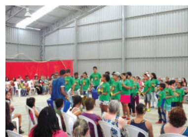
Antigo ginásio, destinado às práticas esportivas e eventos comunitários