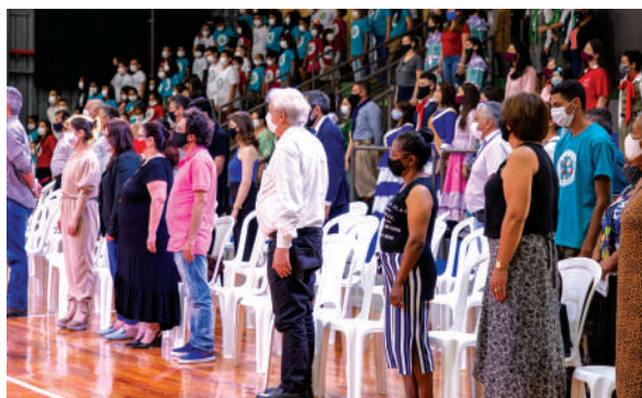
Público na cerimônia de inauguração