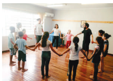
Oficina de Teatro