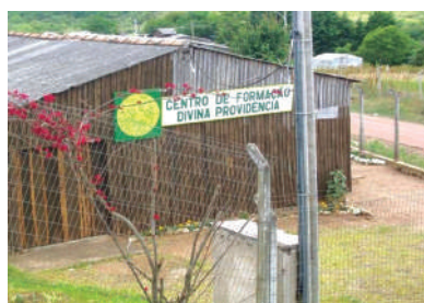
Primeira Sede do Centro de Formação Divina Providência

Seguimos crescendo, acreditando na força do amor, do trabalho, da educação e da cultura como agregadores e formadores de uma sociedade mais justa e fraterna. Nossos mais sinceros agradecimentos a todos os parceiros que comungam desses valores e permitem que sigamos em saudável desenvolvimento.