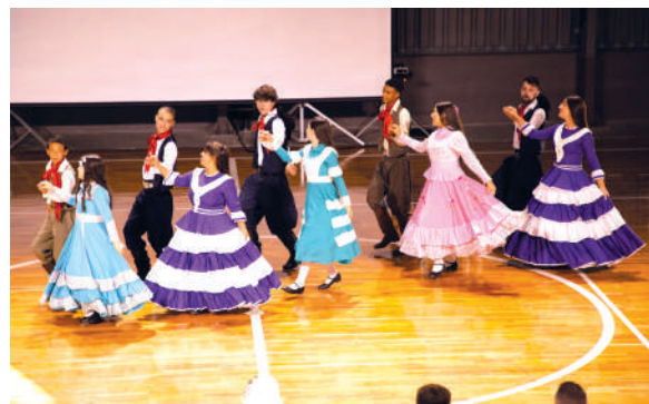
Apresentação de Dança Gaúcha