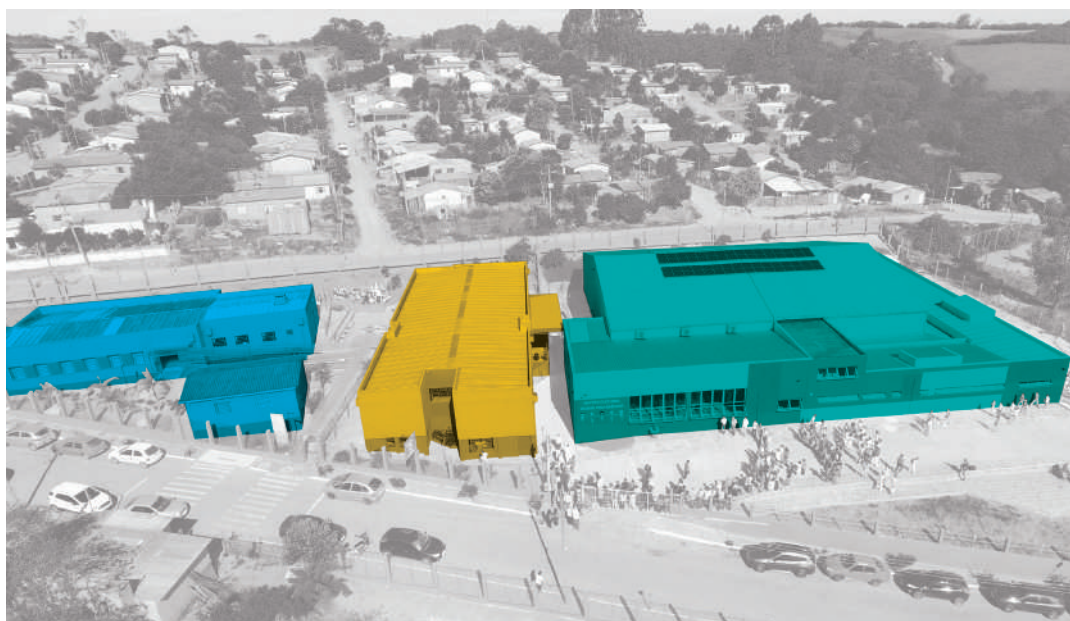
■ 2016 • Nova área de alimentação ■ 2012 • Área pedagógica ■ 2021 • Ampliação Cultural

Sua edificação foi inspirada em princípios que norteiam as ações de responsabilidade social do Centro de Formação Divina Providência: cooperação comunitária, valorização da vida e da dignidade humana, e sustentabilidade.