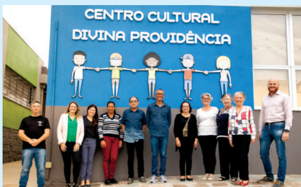
Voluntários do Divina – Diretoria, Conselho Fiscal e colaboradores

• Promover e estimular a regionalização da produção cultural e artística brasileira, com valorização de recursos humanos e conteúdos locais.