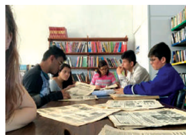
Oficina de Comunicação: Jornal "Divina Fala"